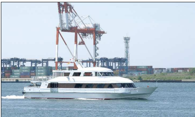
港務艇「ぽーとおぶなごや2」

※往復はがきで応募の方は返信はがき、インターネットで応募の方は当選者にメールで発表します。