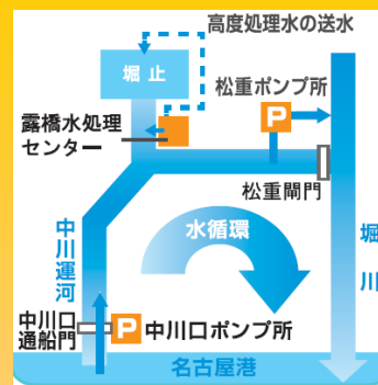
中川運河の水循環