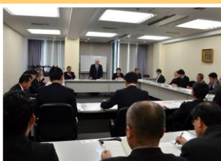
名古屋港外航クルーズ船 誘致促進会議