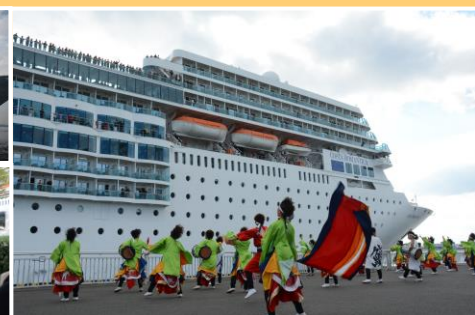
ガーデンふ頭に大型クルーズ船「コスタ ネオロマンチカ」が寄港