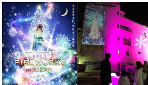
チラシ・ポスター