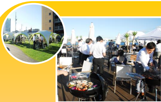
ガーデンふ頭ひがし広場 バーベキューレストラン