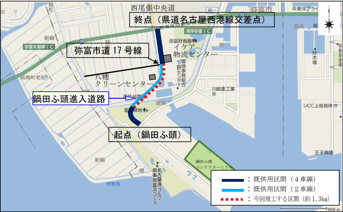
鍋田ふ頭進入道路位置図