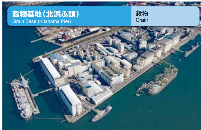
穀物基地 (北浜ふ頭) Grain Base (Kitahama Pier) 穀物 Grain

This is an artificial island built in 1961, with an area of approximately 2.1 million m 2 . The total storage capacity of the petroleum tank complex is 800,000 kl. The base supplies energy to surrounding areas including Nagoya City. The site is surrounded by a tide protection wall that is 6.0 m to 6.8 m high above the Nagoya Point to protect various hazardous material storage facilities from high tides.