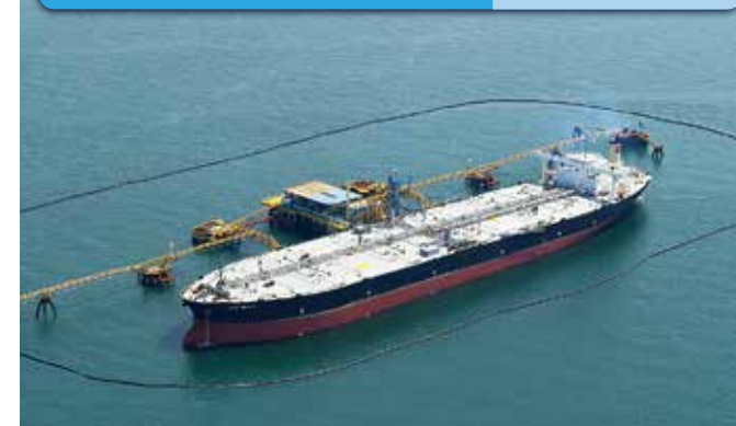
伊勢湾シーバース Isewan Sea Berth 原油 Crude Oil

南北500m、水深26mの固定式橋式の洋上原油受け入れ基地です。十分な水深を求めて高潮防波堤南の伊勢湾中央に1975年(昭和50年)完成。31万重量トン級タンカーの係留が可能です。原油は、2本のパイプラインを通して約10km離れた北浜・南浜ふ頭の石油基地へ送られます。