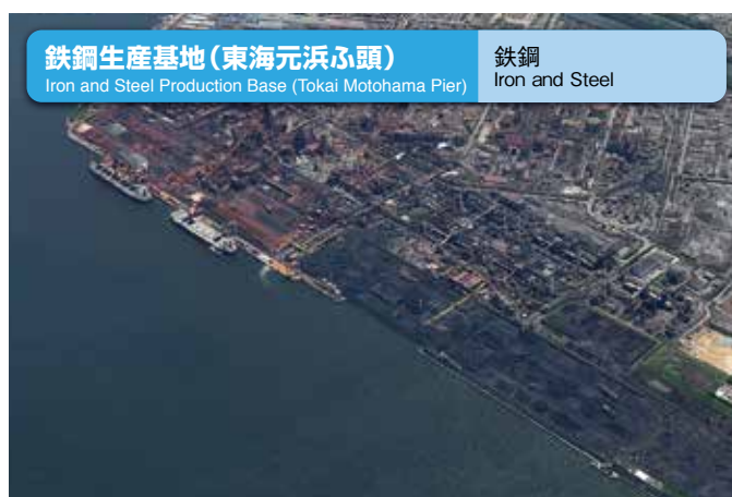
鉄鋼生産基地 (東海元浜ふ頭) Iron and Steel Production Base (Tokai Motohama Pier) 鉄鋼 Iron and Steel

The terminal features specialized berths for grain handling, including one capable of accommodating 65,000-ton-class vessels, where grains such as wheat and corn are loaded/discharged. There are about 800 grain silos of different sizes, which have a total capacity of approximately 510,000 tons. Behind the silos are food-related companies, where imported grains are processed on site into flour, blended feed, cornstarch, glucose, grain whisky and other products.