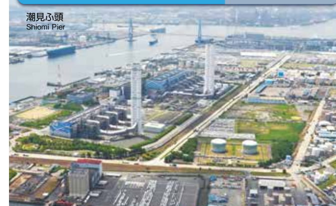
火力発電所 Thermal Power Station 電力 Electricity

名古屋港には4つの火力発電所が立地しています。燃料となる石油・LNGを名古屋港内から調達し、地域の電力需要を支えています。