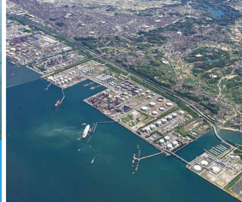
石油・LNG基地 (北浜ふ頭・南浜ふ頭・南5区) Petroleum Oil and LNG Base (Kitahama and Minamihama Piers, South-5 Section) 石油・LNG Petroleum Oil and LNG

The Port of Nagoya has four thermal power stations. They receive fuels in the form of petroleum oil and LNG from plants within the Port to support power demand in the region.