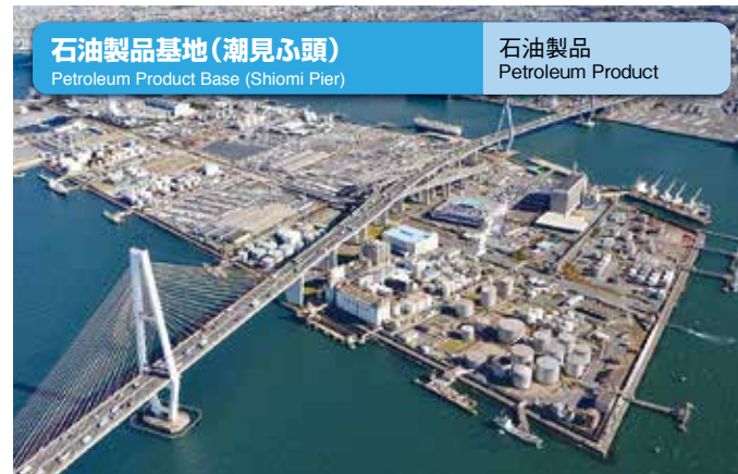
石油製品基地 (潮見ふ頭) Petroleum Product Base (Shiomi Pier) 石油製品 Petroleum Product

約210万㎡のスケールの人工島。1961年(昭和36年)に完成しました。立ち並ぶ石油タンクの総貯蔵能力は約80万kl。名古屋市など周辺地域へのエネルギー供給基地として活躍。数々の危険物施設を高潮から守るため、基地は名古屋港基準面より+6.0m~6.8m高の防潮壁に囲まれています。