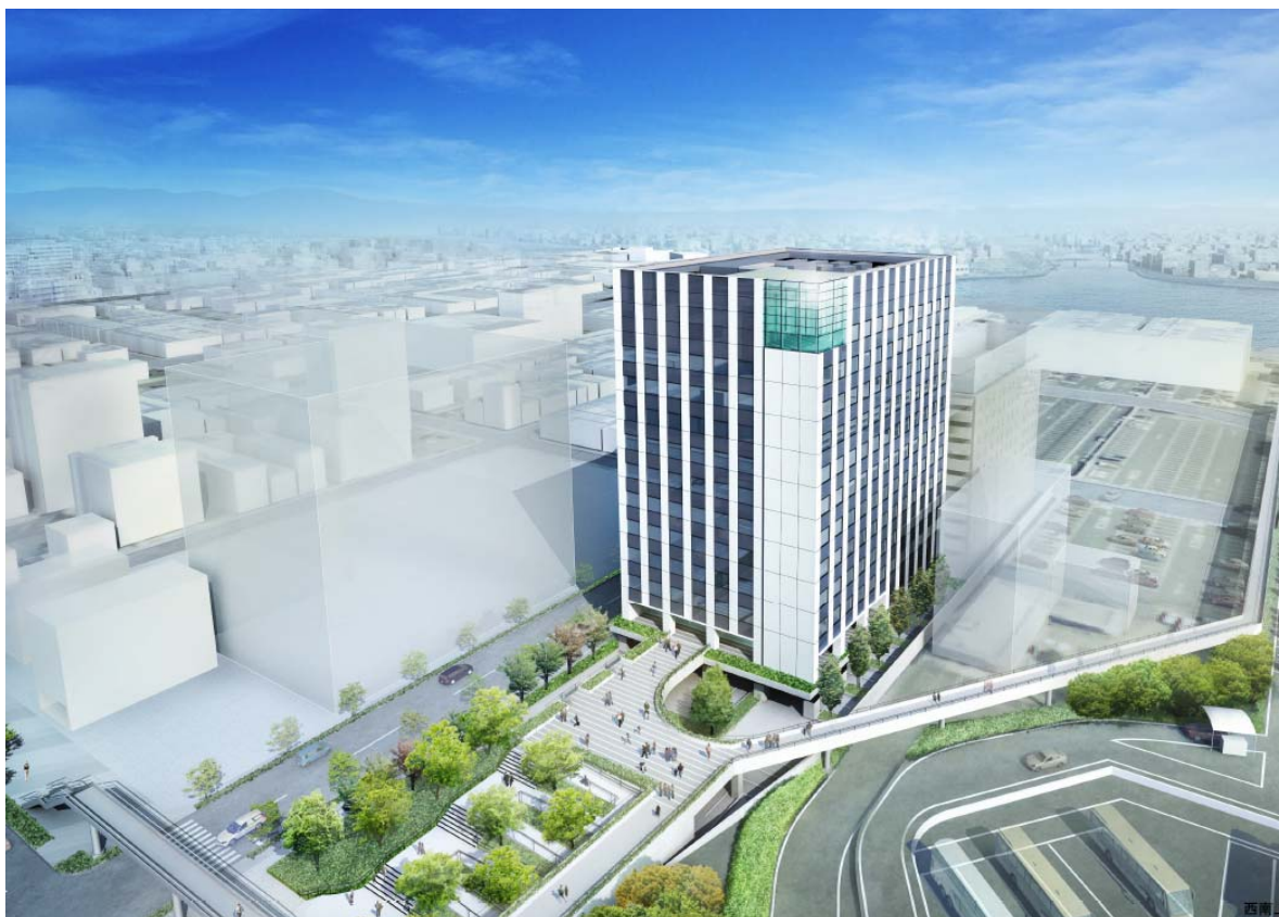
本庁舎・港湾会館（イメージパース）

※本図は参考資料として提出されたものであり、実際の建築イメージとは異なる場合があります。