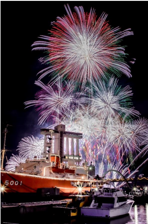
(撮影場所：ガーデンふ頭 ジェティ広場)