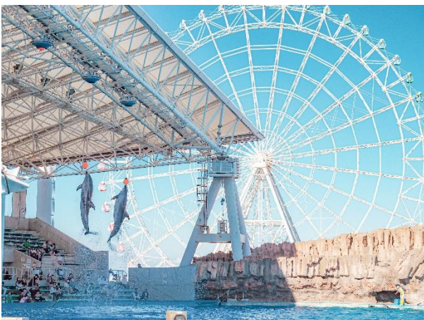
@yamamoomoo さん (撮影場所：ガーデンふ頭 名古屋港水族館)