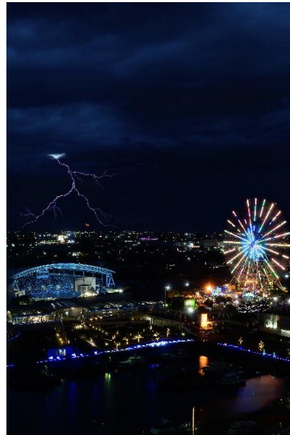
@ana_back.yard.garage さん (撮影場所：ガーデンふ頭 名古屋港ポートビル)