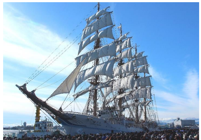
(撮影場所：ガーデンふ頭 3号岸壁)