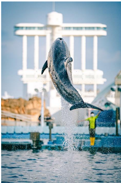
@como_photograph さん (撮影場所：ガーデンふ頭 名古屋港水族館)