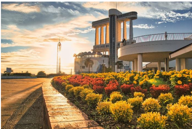
(撮影場所：ガーデンふ頭 展望広場)