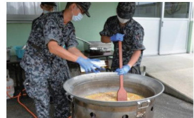
炊事車による炊き出し訓練