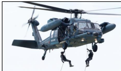
孤立者の捜索・救助・救護訓練