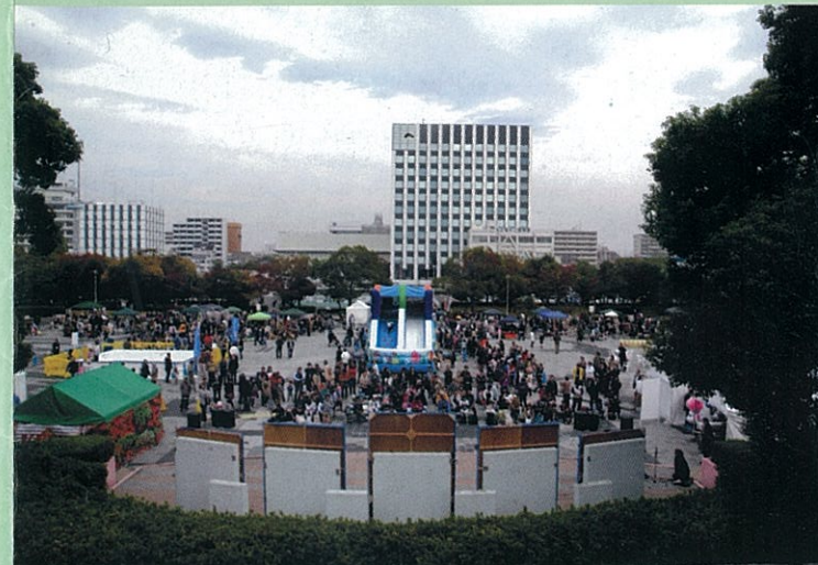
▲ガーデンふ頭臨港緑園(つどいの広場)