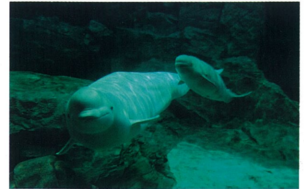
▲オーロラの海（ベルーガ）