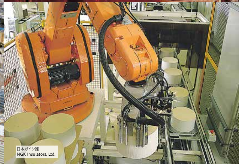
日本ガイシ㈱ NGK Insulators, Ltd.