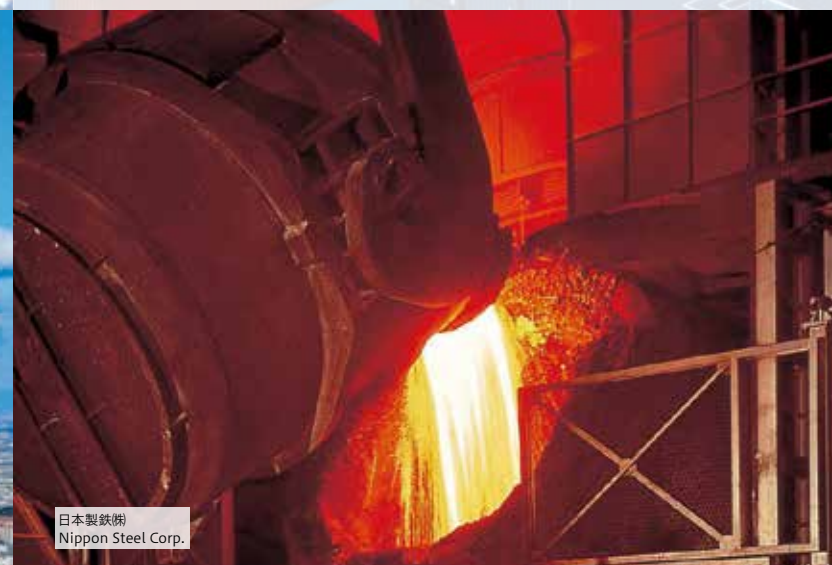
日本製鉄㈱ Nippon Steel Corp.

輸送用機械器具／電気機械器具／鉄鋼／ 生産用機械器具／食料品 Transportation equipment / Electrical machinery, Equipment and Supplies / Iron and steel / Production machinery / Food