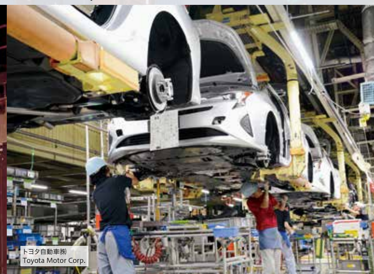
トヨタ自動車㈱ Toyota Motor Corp.