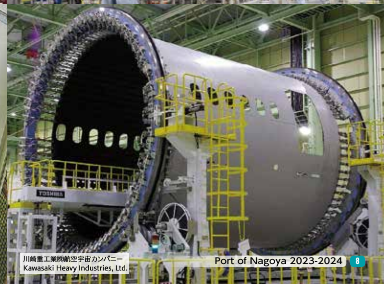
川崎重工業㈱航空宇宙カンパニー Kawasaki Heavy Industries, Ltd.