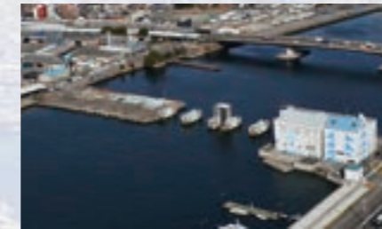
堀川口防潮水門 Tide gates at Horikawa River estuary

伊勢湾台風級の高潮に備えて整備された水門が、高潮による浸水を防ぎます。水門閉鎖時には、併設されたポンプ所内のポンプにより、堀川に流入してきた水を海側に排水します。台風時の高潮はもちろん、異常潮位による浸水などからも地域を守っています。