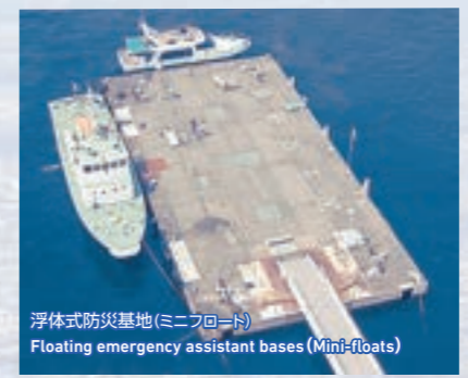
浮体式防災基地(ミニフロート) Floating emergency assistant bases (Mini-floats)

浮体式防災基地 (ミニフロート) Floating emergency assistant bases (Mini-floats) 耐震強化岸壁を補完することを目的とする浮体式の構造物で、金城ふ頭とガーデンふ頭に大小2基を設置。災害時には被災地に曳航され、海上からの支援活動に使用されます。 These floating structures are intended to supplement the quake-resistant berths. There are two bases of different sizes at Kinjo and Garden Piers. In emergencies they can be towed to affected areas and used for support activities from the sea.