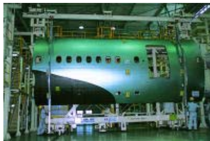
航空機胴体の製造工場