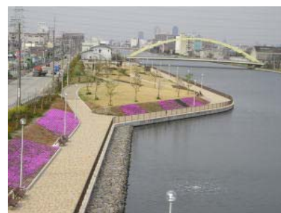
中川運河中川口緑地