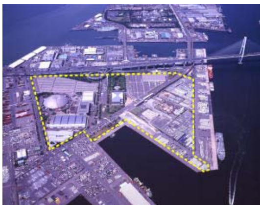
交流エリア(点線で囲んだ部分)