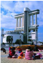
名古屋港ポートビル