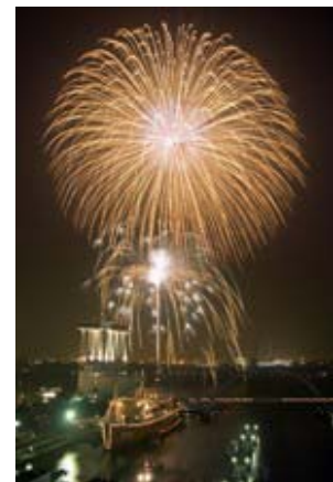
名古屋みなと祭花火大会