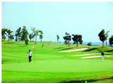
名古屋港ゴルフ倶楽部(富浜コース)