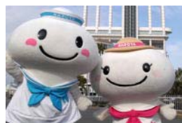
マスコットキャラクター ポータン・ミータン