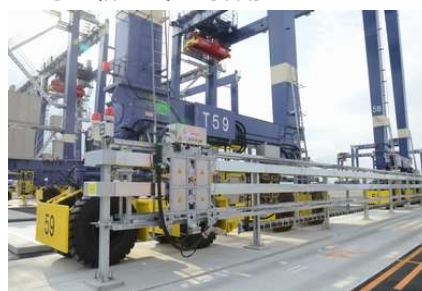
架線から給電を受けるバスバー方式の RTG