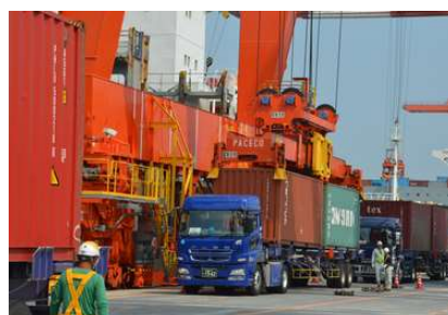
T3 のガントリークレーン。20ft コンテナを 2 個同時に吊り上げることができる ツインスプレッダーや免震装置を採用している。