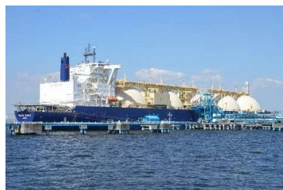
着岸中の LNG 船（モス型）

ここから港内の海底を掘り抜き、対岸の三重県川越町の発電所と同県四日市市の都市ガス工場までを結ぶ「伊勢湾横断ガスパイプライン」が平成 25 年に完成しました。海底トンネルで敷設するガス導管としては国内最長級のトンネル部総延長約 17.3km の長さを誇ります。