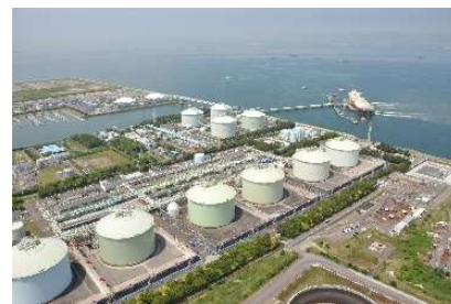
南 5 区の LNG タンク