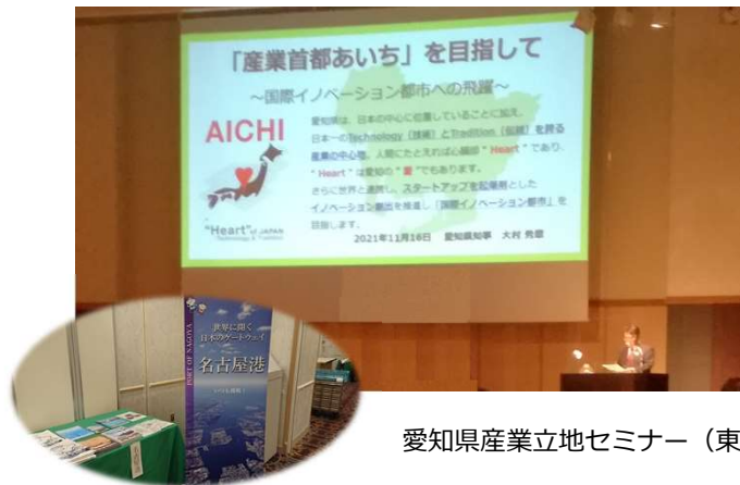
愛知県産業立地セミナー（東京）