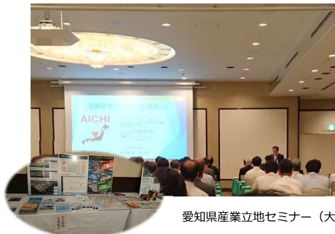
愛知県産業立地セミナー（大阪）