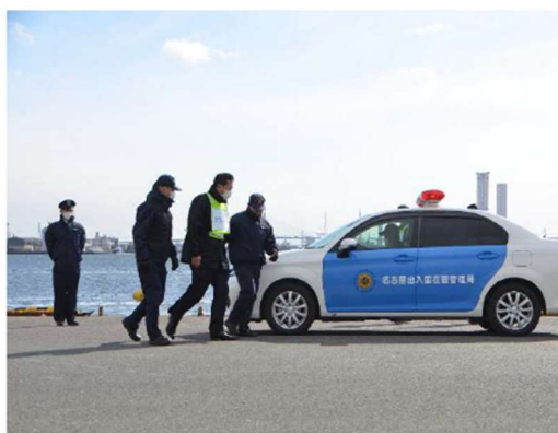
名古屋出入国在留管理局によるブラックリスト該当者の連行