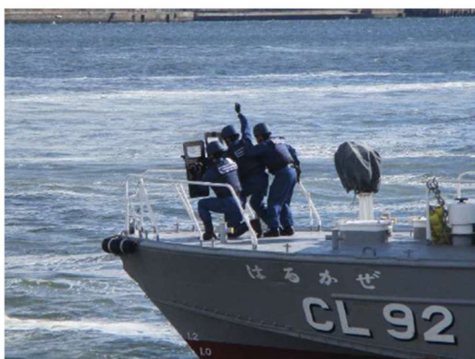
海上保安庁の巡視艇「はるかぜ」の制圧班