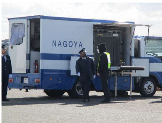
名古屋税関によるX線車を使用した手荷物検査