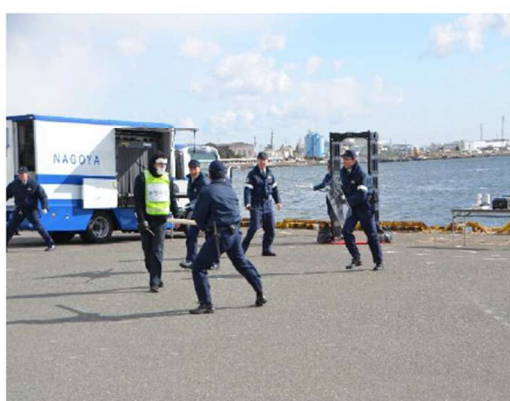
愛知県警察によるテロリストの制圧

※名古屋港保安委員会は、各機関の連携による保安の向上と入出管理の強化を図り、相互に協力するなどして防犯諸対策を講じ、「安全で安心な名古屋港づくり」を推進することを目的に、平成16年1月に設立されたもので、保安に関する関係行政機関及び関係団体等(35機関)の委員で構成されています。