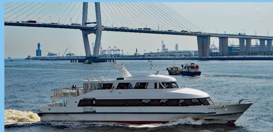
ぽーとおぶなごや2（港務艇）