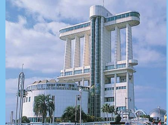
名古屋港ポートビル