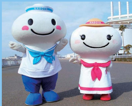
ポータン・ミータン