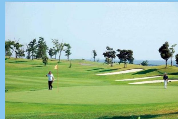
名古屋港ゴルフ倶楽部