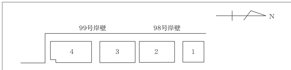
図 (飛島ふ頭西A荷さばき地)